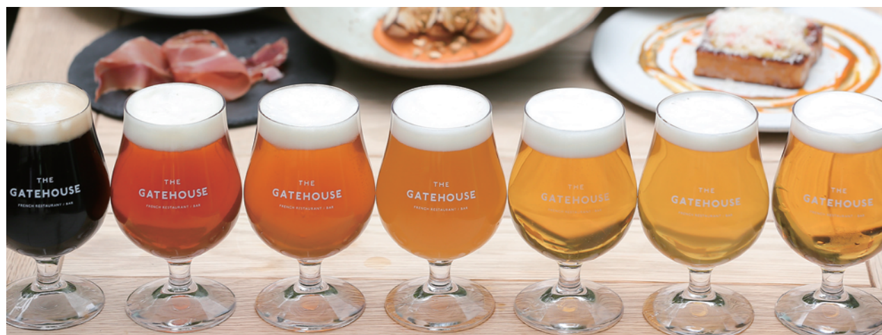
※ビールラインナップイメージ