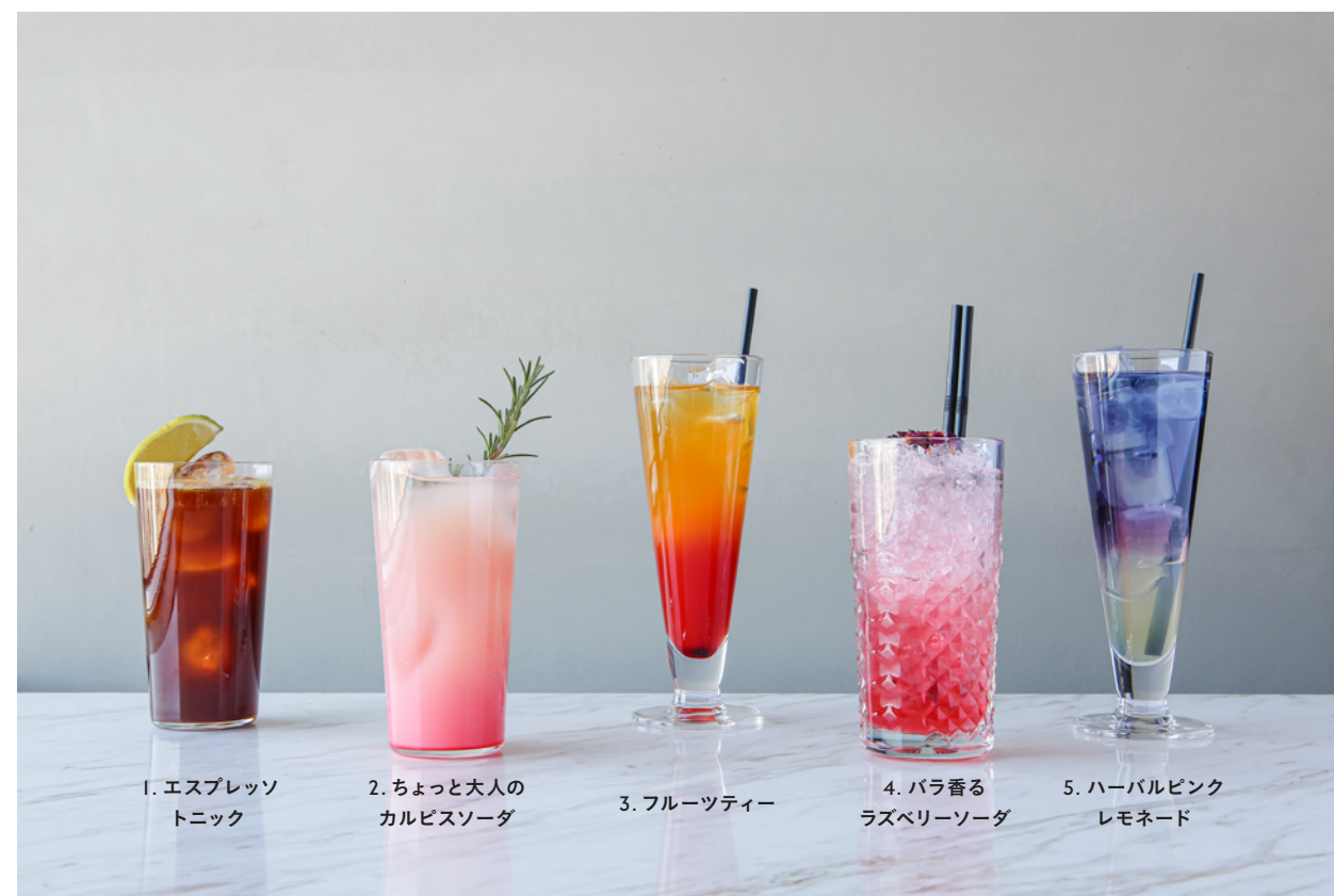
1. エスプレッソ トニック 2. ちょっと大人の カルピスソーダ 3. フルーツティー 4. バラ香る ラズベリーソーダ 5. ハーバルピンク レモネード